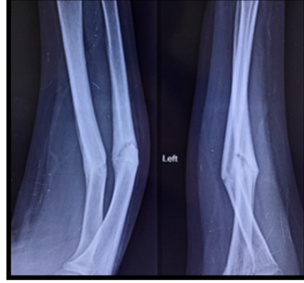
অগ্রহণযোগ্য খারাপ দেখতে এক্স-রে